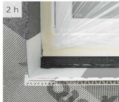
Obrázok 2 e - h: priebeh spracovania

Sto Slovensko, s.r.o. Pribylinská 2 SK - 83104 Bratislava Telefón: 2-44 64 81 42 Fax: 2-44 45-30 75 info.sk@sto.com www.sto.sk