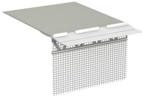
obr. 1: StoFentra Guard rohový kus a stredný kus